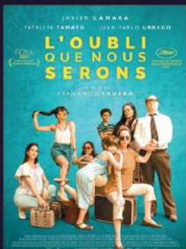
L'OUBLI QUE NOUS SERONS de Fernando Trueba