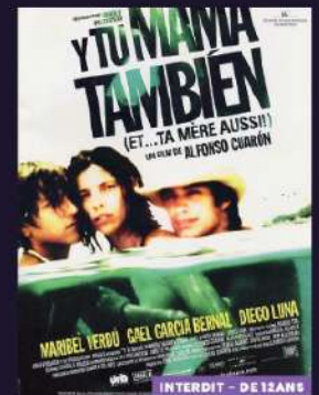
ET... TA MÈRE AUSSI! de Alfonso Cuarón

«La Colombienne Laura Mora nous montre la réalité d'un pays frappé par la violence à travers l'histoire intime d'une fille qui a écartonné l'assassin de son père. Une réflexion touchante sur le sentiment de vengeance et la possibilité de pardonner.» Les Fiches du Cinéma